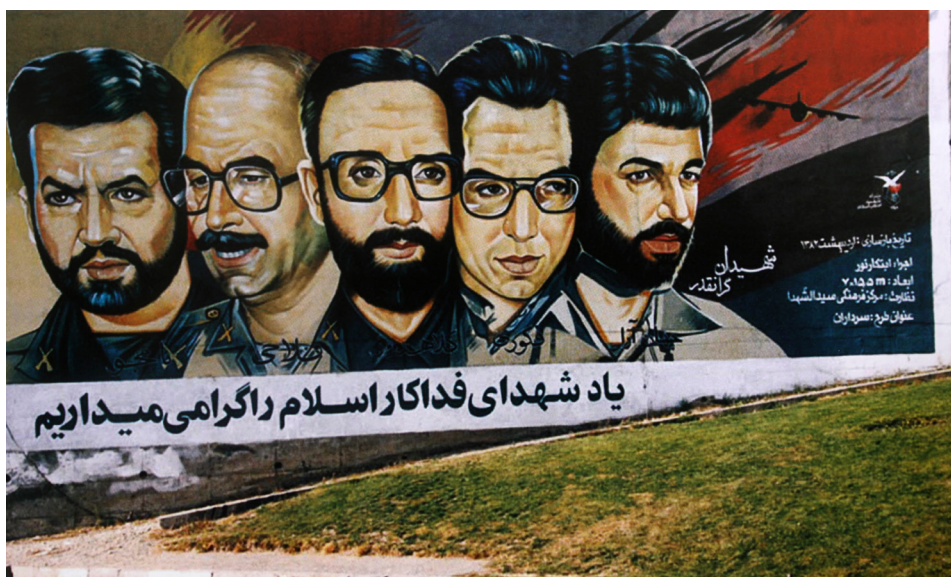
تصویر ۱: تعدادی عکس پرسنلی با ترکیب‌بندی غیرقابل قبول (به علت عدم رعایت اندازه چهره‌ها نسبت به یکدیگر و ترکیب‌بندی نامناسب).

نقاشی‌های واقع‌گرایانه از شهدا در بعد از جنگ ایران و عراق به‌عنوان جنبشی که ارزش‌های فرهنگی، اجتماعی و هنری را در پرتره شهدا بازنمایی می‌کنند در این بخش از مقاله مورد بررسی قرار می‌گیرند. عکس‌های پرسنلی شهید مضمون مشترک بسیاری از این آثار است. گرایش جامعه به بازنمایی واقع‌گرای تصاویر شهدا و نمایش تمثال ایشان در منظر شهری، احساس نیاز به هم‌گرایی جامعه پس از جنگ را نمایش می‌دهد. در آن دوران جامعه به یادآوری ارزش‌های ملی-مذهبی و بازنمایی آن‌ها نیاز داشت. بسیاری از جوانان در زندگی روزمره دغدغه دوران جنگ و ارزش‌های آن را ندارند و شهدا موجوداتی فرازمینی محسوب می‌شوند که در اجتماع جایگاهی نداشته و یا حداقل مشکلات زندگی فردی