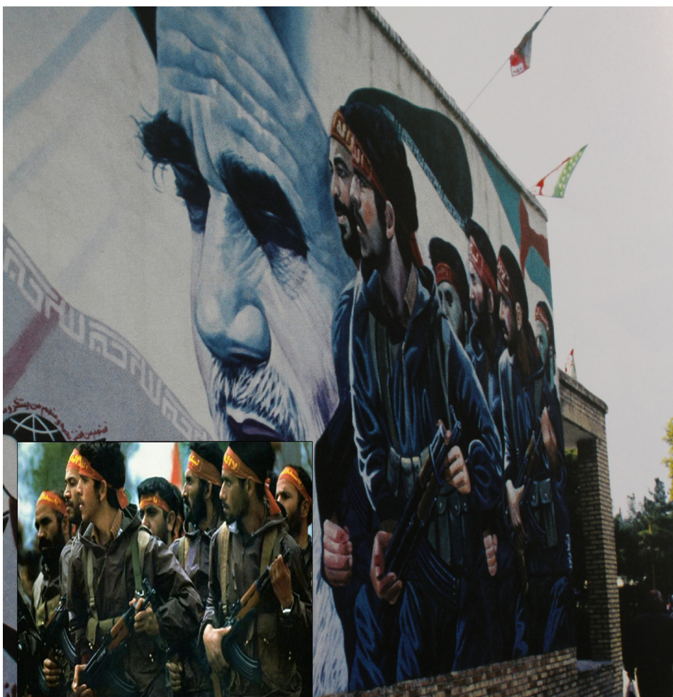
تصویر ۵: لباس سبز سربازان، شرنگ قرمز سربندها و نوشته‌های زرد رنگ بر روی سربندها.

روزمره به وجود آید. نقاشی‌های دیواری واقع‌گرای شهیدا در شهر گفتمان «شهید زنده» را به نمایش درآورد. مجالی که جامعه ایرانی و حتی گردشگران خارجی بودن در کنار شهید را تجربه کنند: تجربه از گفتمان تاریخ رشادت و شهادت در زمان و مکانی متفاوت. در حقیقت این نقاشی‌های واقع‌گرا حافظه جمعی جامعه را تحت تأثیر قرار می‌دهد. گفتمان نقاشی‌های دیواری واقع‌گرا به کمک ساختار ساده خود با گروه عظیمی مخاطب ارتباطی صمیمی برقرار می‌نماید. گفتمان نقاشی‌های دیواری شهیدا تلاش دارد مخاطب را به اندیشیدن وا دارد (Sreberny, 2013: 219).