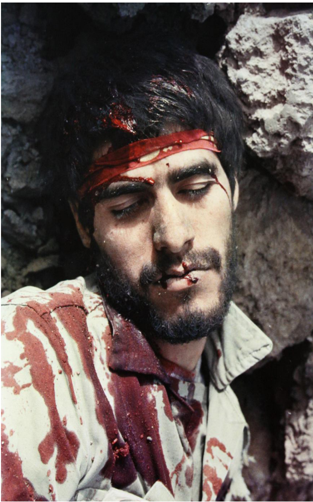
تصویر ۴: شهادت و رستگاری. عکس: احسان رجبی. مأخذ: رجبی و اشتری، ۱۳۹۴.

باورهای سنتی انقلاب (هم چون خودکفایی) را به زیر سؤال برد. اینترنت و رسانه‌های مجازی نیز کنترل فضای فکری شهروندان را سخت‌تر نمود. همه این‌ها تعدادی از عوامل در تغییر اجتماعی در ایران محسوب می‌شوند. تا آنجا که دولت‌مردان ایران از تهاجم فرهنگی و بحران جوانان سخن گفتند و نقاشی دیواری یکی از ده‌ها راه برای مقابله با این تهاجم است، بیشتر مورد توجه قرار گرفت و به دلایل فوق نقاشی‌های دیواری هر چه بیشتر در شهرها حضور یافتند. البته این نقاشی‌ها فقط مورد حمایت دولت نبودند بلکه عامه مردم از این نقاشی‌ها استقبال می‌کردند و این مسئله به‌عنوان عامل حمایت‌کننده و پایگاه مردمی این سبک بایستی مورد توجه قرار گیرد (کفشچیان مقدم، ۱۳۸۵: ۲۵). بسیاری از نقاش‌هایی که به این شیوه نقاشی می‌کردند، کسانی بودند که هنرمند آکادمیک محسوب نمی‌شوند و حتی بعضی از آن‌ها پرده‌های تبلیغات سردر سینماها را نقاشی می‌کردند. در