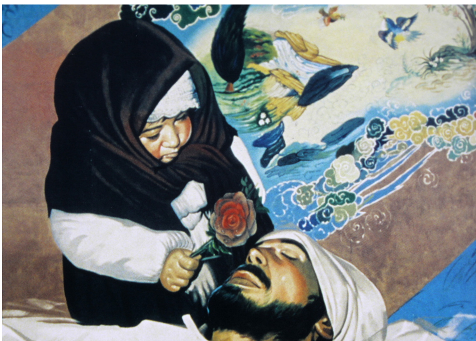
تصویر ۳: تصویر شهید و فرزند که در بزرگراه مدرس اجرا شده بود.

فیزیکی (از بین رفتن امکانات) و چه غیر از آن مانند تغییرات گسترده هرم جمعیتی و نهاد خانواده (اباذری، ۱۳۸۱: ۳۲) تا تغییرات نهادهای بزرگ جامعه مانند دولت. در اسلام، جهاد در راه خدا یک وظیفه شرعی است. در قرآن آمده است که «با کسانی که به خداوند و رستخیز ایمان ندارند و آنچه که خدا و رسولش حرام کرده، حرام نمی‌دانند، جنگ کنید و نیز با اهل کتاب که به دین حق نمی‌گروند، بجنگید. با آنان تا هنگامیکه به دست خود جزیه دهند و تسلیم شوند بجنگید» (سوره توبه، آیه ۲۹). در آیه دیگری به جهادگران خداوند بشارت می‌دهد: «اموال و جان خویش را فدا کنید ... خداوند گناهان شما را خواهد بخشید. خداوند شما را به باغ‌هایی که زیر درختانش نهرها جاری است، وارد خواهد کرد» (سوره توبه، آیات ۸۹-۸۸). جنگ در راه اسلام جهاد نامیده می‌شود. هنر دفاع مقدس وابسته به زمینه اجتماعی خلق این آثار است. هنرمندان با استفاده از نمادها جنگ را به‌عنوان امری مقدس به جامعه معرفی می‌کنند و از جنگ به‌عنوان هدیه‌ای الهی یاد می‌کنند تا در آن انسان‌ها به کمال و قرب الهی برسند. این شیوه بازنمایی از جنگ خود بازتولید گفتمان‌هایی است که تنها با شناخت زمینه‌های اجتماعی آن تفسیرپذیر خواهد بود. در جنگ ایران و عراق، جنگ معنای اسلامی خود یعنی جهاد و دفاع را بازنمایی می‌کنند. در اسلام تمام جنگ‌ها جز جهاد نفی می‌گردند و معنای جهاد یعنی جنگیدن در راه خدا. وظیفه جهادگران رویارویی با کافران و